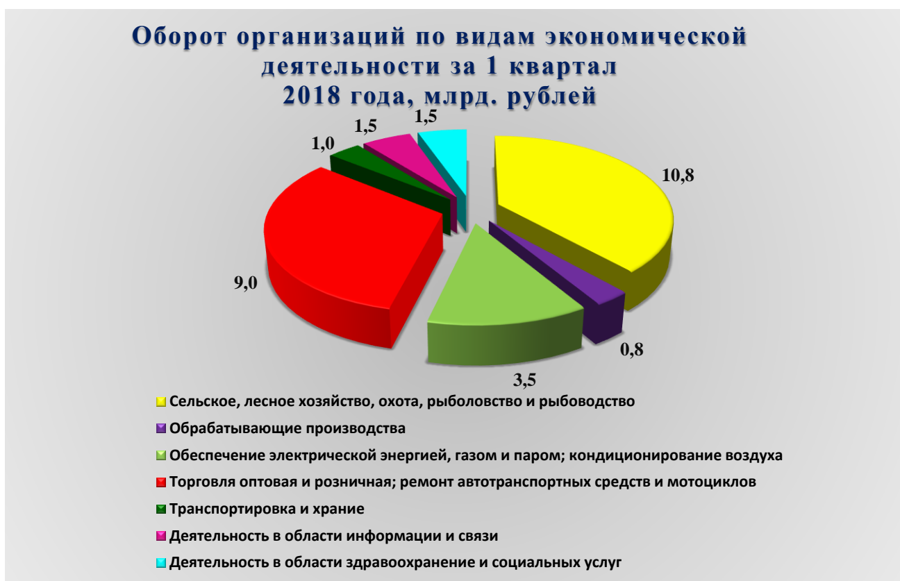
Рис. 1. Оборот организаций по видам экономической деятельности за 1 квартал 2018 года, млрд. рублей

В январе - марте 2018 года оборот организаций Петропавловска-Камчатского городского округа по всем видам экономической деятельности в действующих ценах составил 30 724,30 млн. рублей, что на 15,1 % выше уровня предыдущего года. Из общего объема оборота организаций на долю организаций сельского, лесного хозяйства, охоты, рыболовства и рыбоводства приходится 35,1 %; на долю организаций оптовой и розничной торговли, ремонта автотранспортных средств и мотоциклов – 29,4 %; на организации, занятые обеспечением электроэнергией, газом и паром, кондиционированием воздуха – 11,3 %.