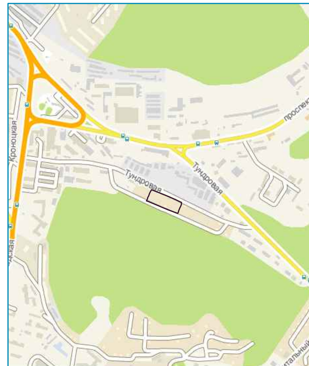
Фрагмент карты расположения элемента планировочной структуры