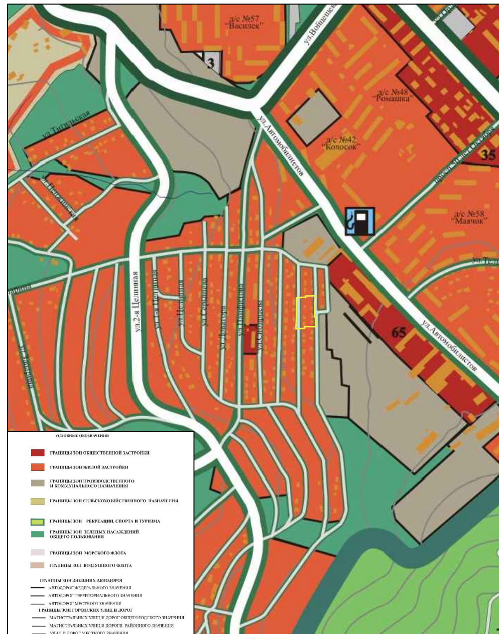
Фрагмент схемы функционального зонирования