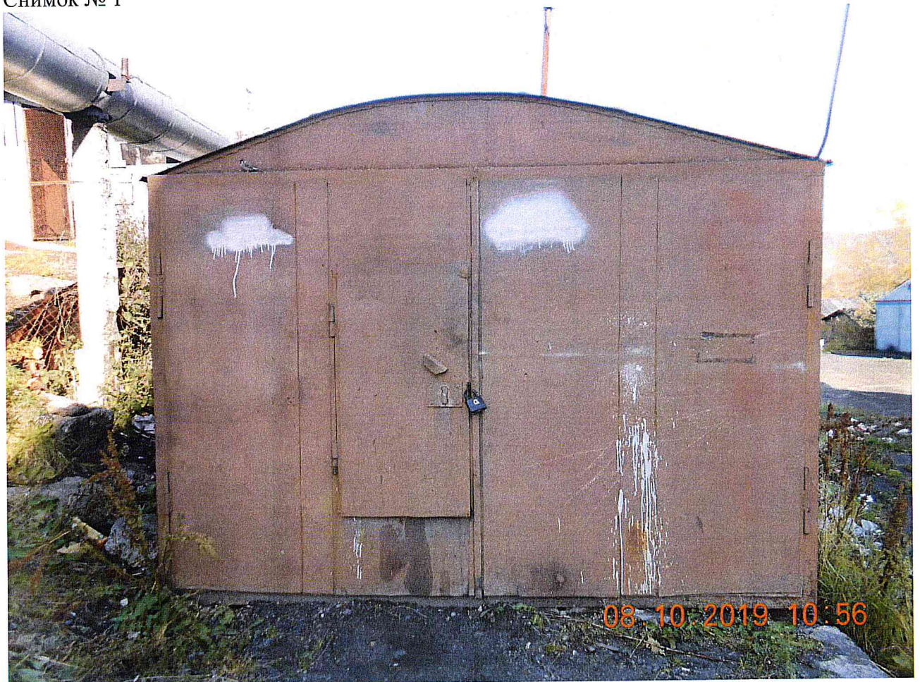
Снимок № 1

(кадастровый номер, либо номер кадастрового квартала, иное описание обследуемой территории с привязкой к индивидуализированным объектам недвижимости)