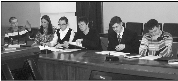
павловск-Камчатского городского округа.

Первым результатом работы 45 молодых депутатов по итогам сессии стало принятие нормативных документов Молодежного Парламента, избрание его Главы и председателя Молодежного Правительства при Главе Петро-