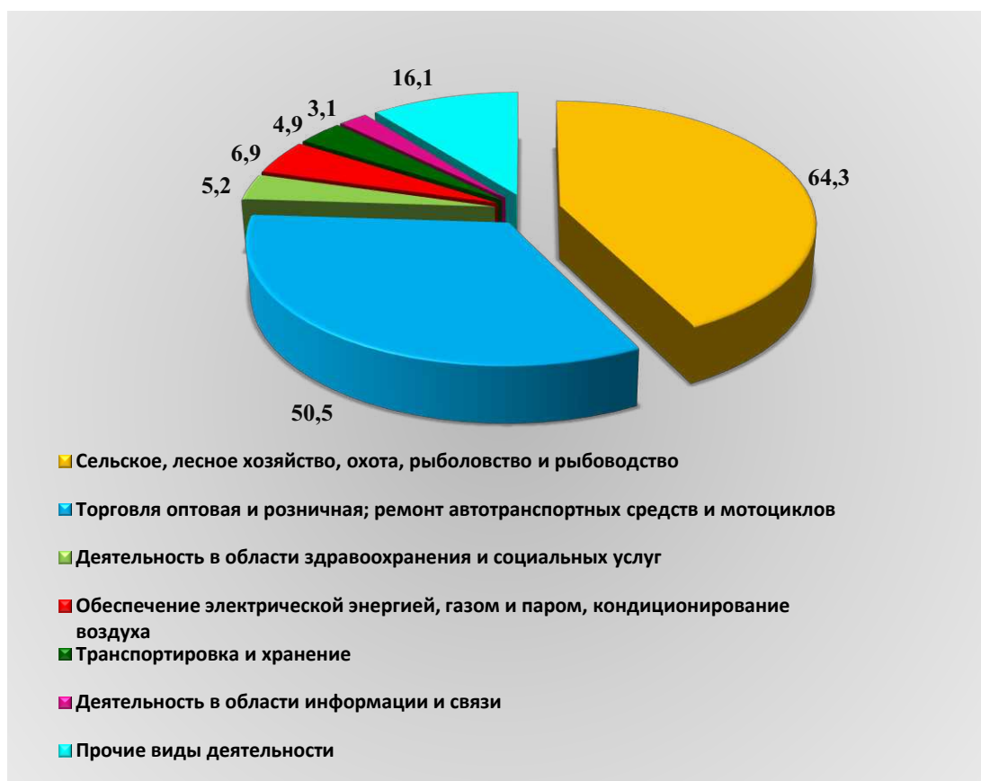
Рис. 1. Оборот организаций по видам экономической деятельности за январь – июнь 2025 года, млрд. рублей.

Оборот организаций по видам экономической деятельности за январь – июнь 2025 года представлен на рисунке (далее – рис.) 1.