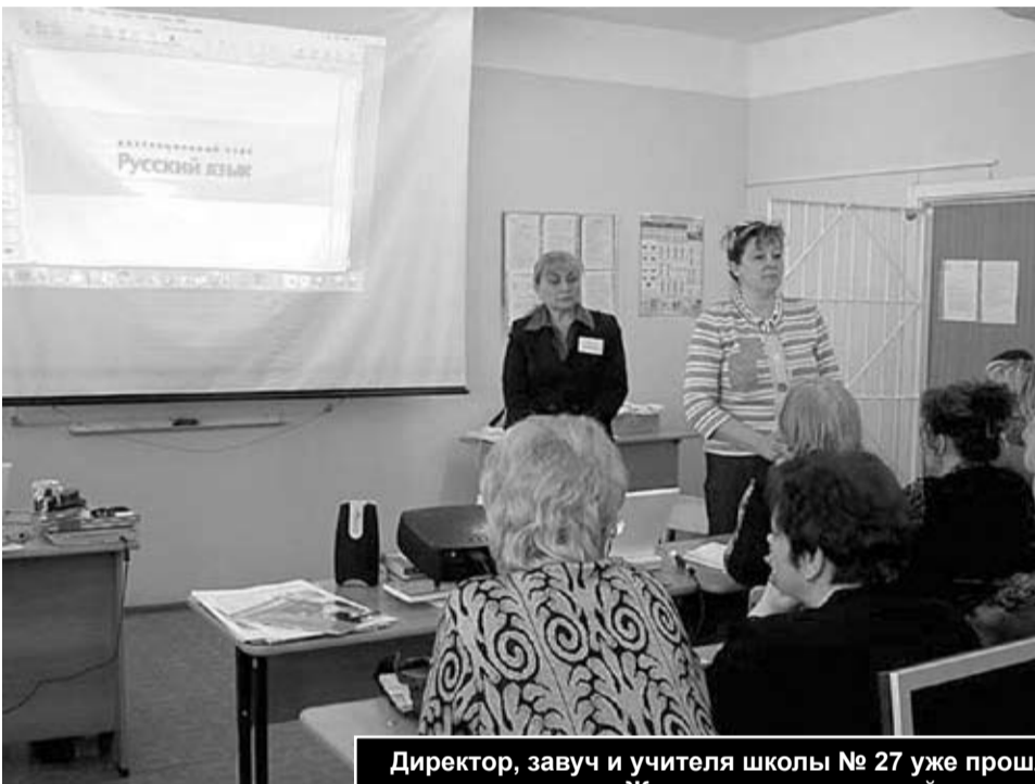
Директор, завуч и учителя школы № 27 уже прошли специальное обучение в рамках проекта «Живая школа», который и помогает детям-инвалидам получить качественное образование