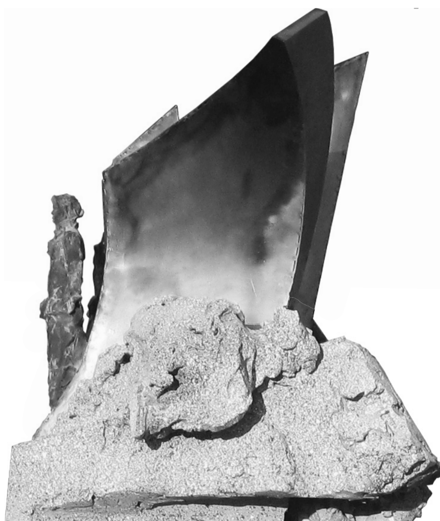
Боковой фасад М1:25