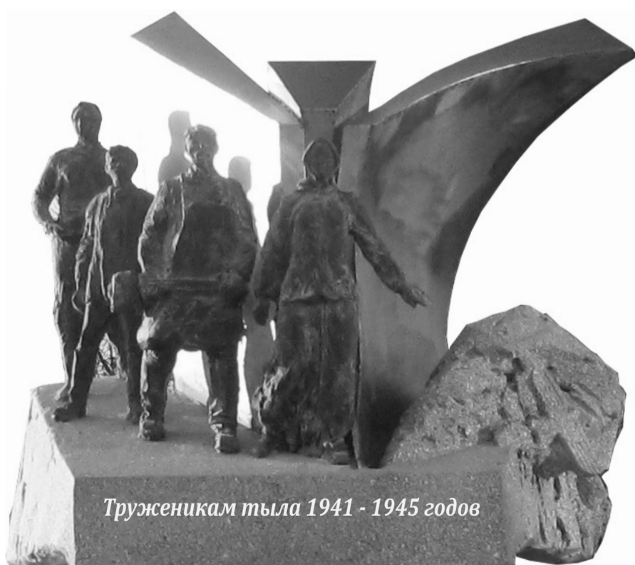
Труженикам тыла 1941 - 1945 годов