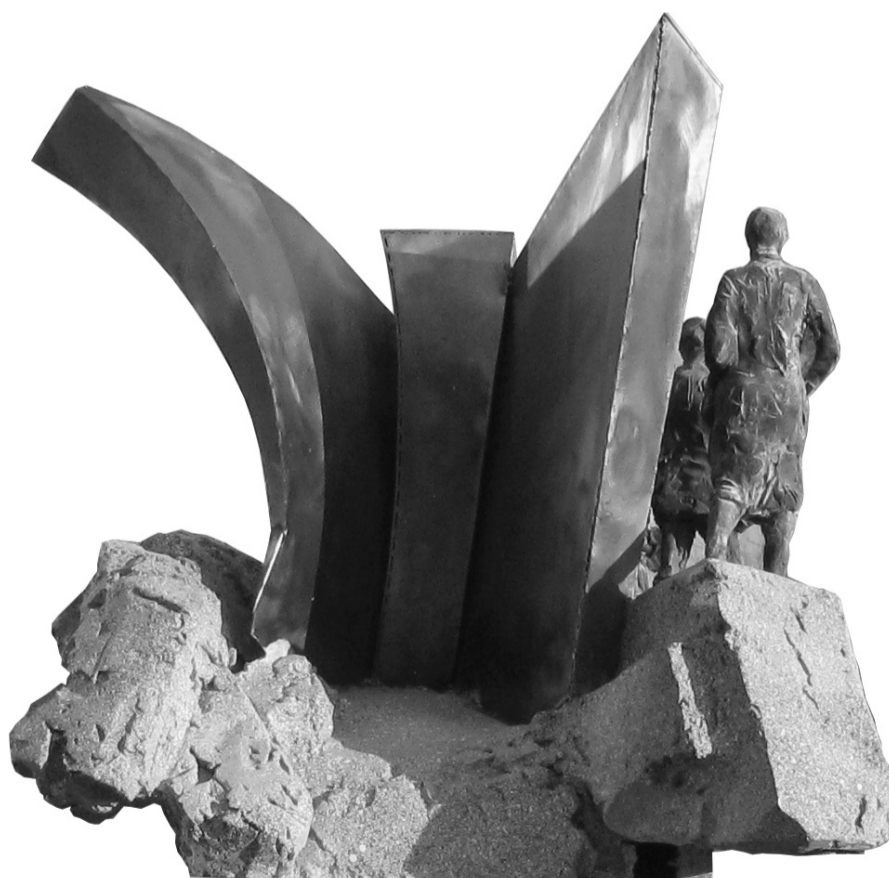
Тыльный фасад М1:25