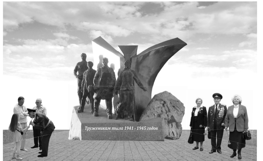
Визуализация (условная ситуация)

Авторы учтут все пожелания жюри конкурса.