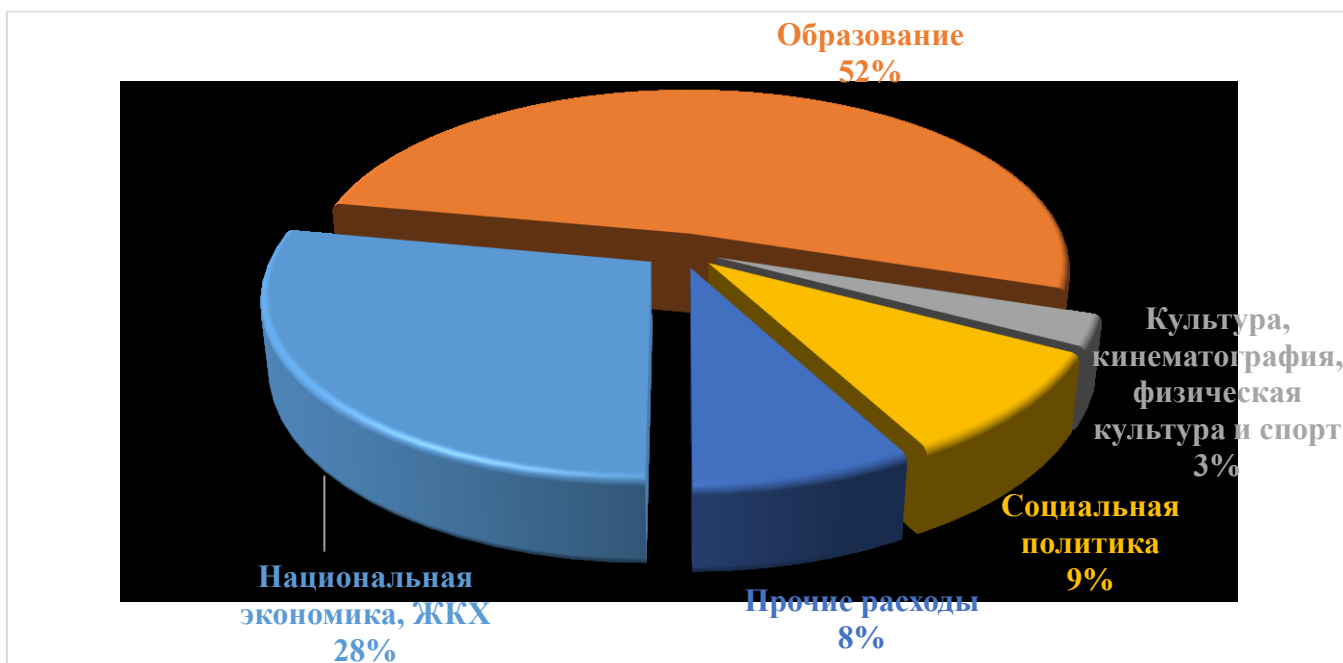
Рис. 3 Структура расходов бюджета городского округа на 2023-2029 годы.

Функциональная структура расходов бюджета городского округа на прогнозный период 2023-2029 годов существенных изменений не претерпевает (рисунок 3).