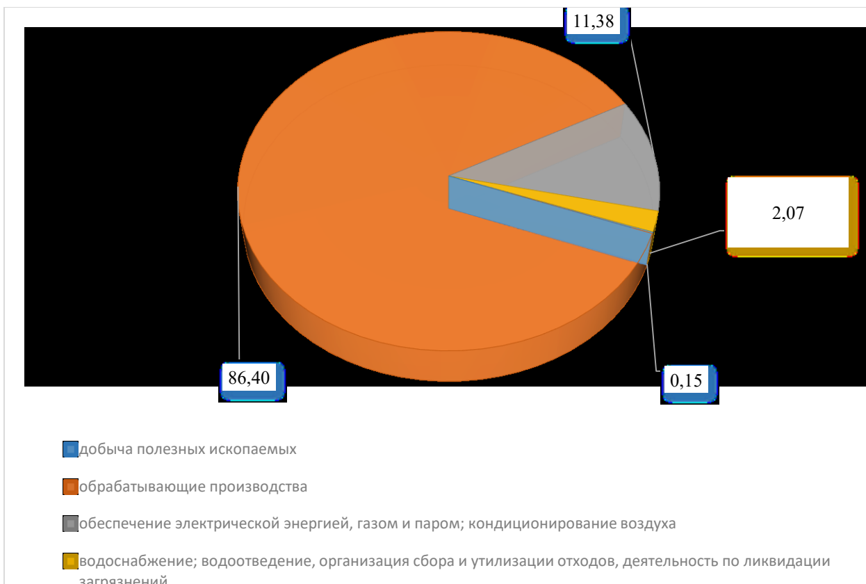
Рис. 1. Структура промышленного производства городского округа в 2021 году

По итогам 2021 года крупными и средними промышленными предприятиями отгружено товаров, работ и услуг, выполненных собственными силами, на сумму 76 078,04 млн. рублей. Индекс промышленного производства составил 110,0 % к уровню 2020 года. Динамику промышленного производства, как и в предыдущие годы, определили обрабатывающие производства.