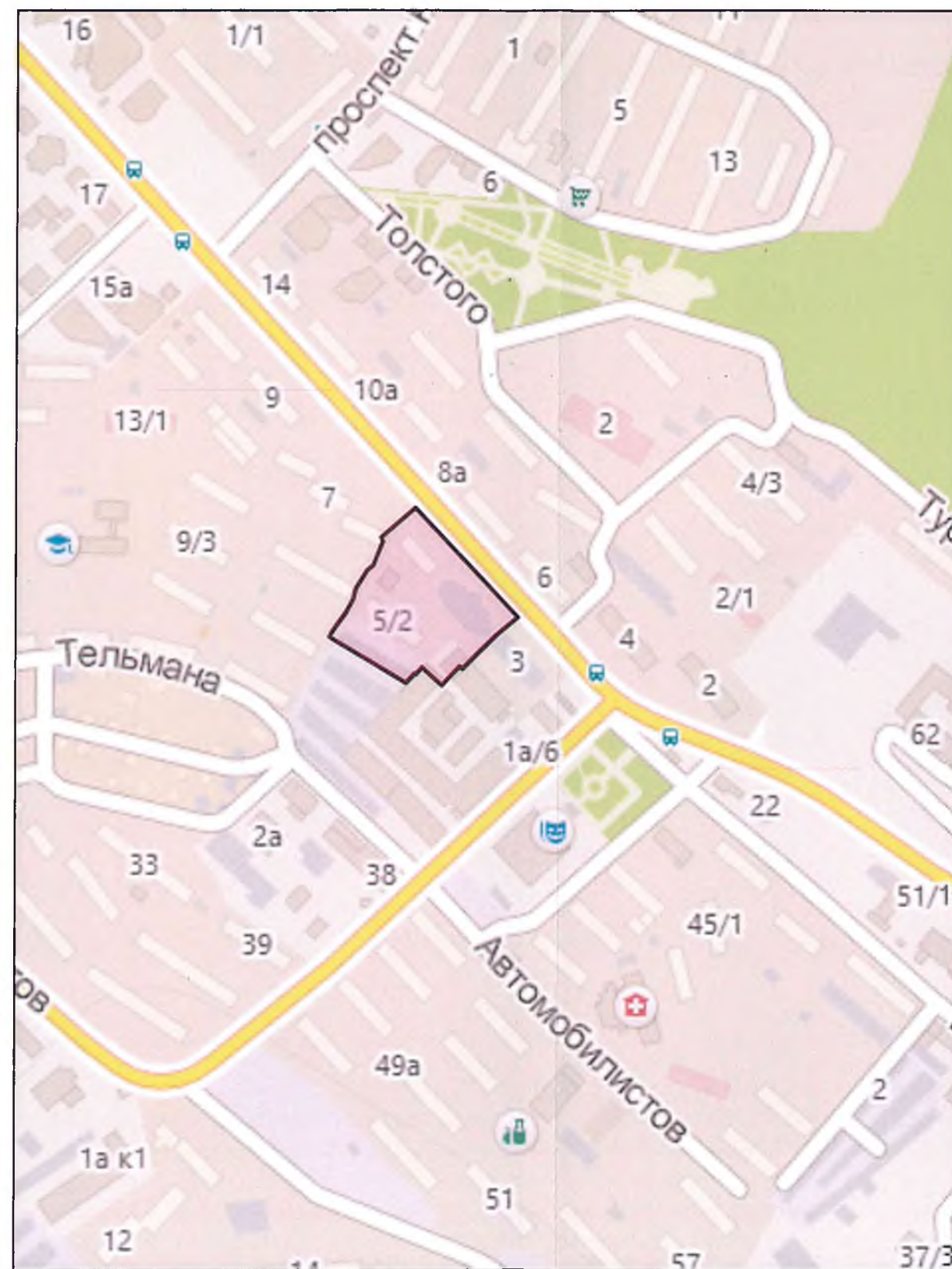
Фрагмент карты расположения элемента планировочной структуры