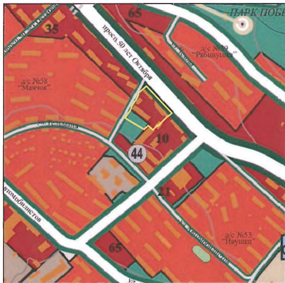
Фрагмент схемы функционального зонирования

Технические решения, принятые в чертежах соответствуют требованиям экологических, санитарно-гигиенических, противопожарных и других норм, действующих на территории Российской Федерации, и обеспечивают безопасную для жизни и здоровья людей эксплуатацию объекта при соблюдении предусмотренных рабочими чертежами мероприятий.