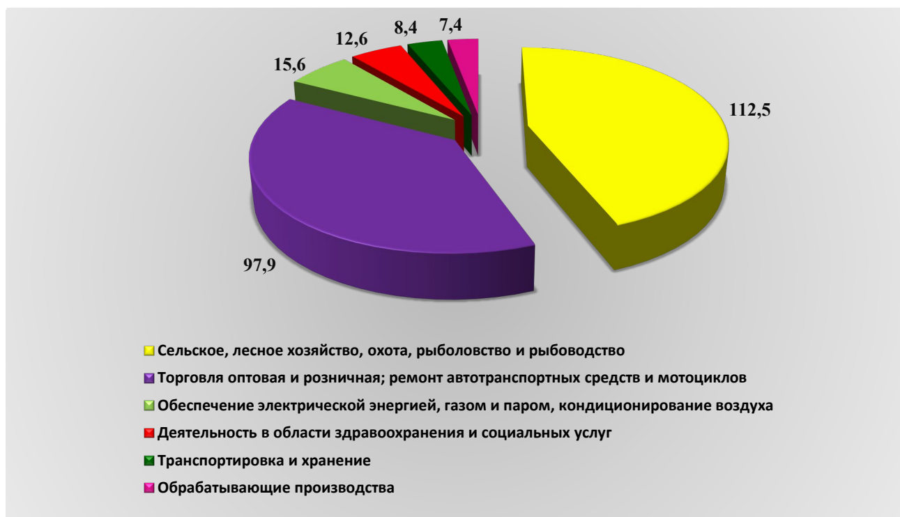
Рис. 1. Оборот организаций по видам экономической деятельности за 2024 год, млрд. рублей

Оборот организаций по видам экономической деятельности за 2024 год представлен на рисунке (далее – рис.) 1.