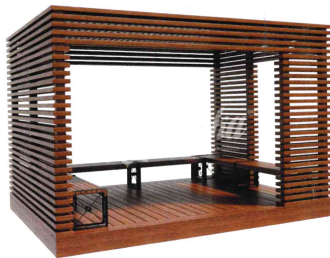
18741 Беседка «София»