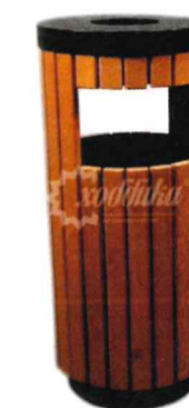
7301 Урна ПА014