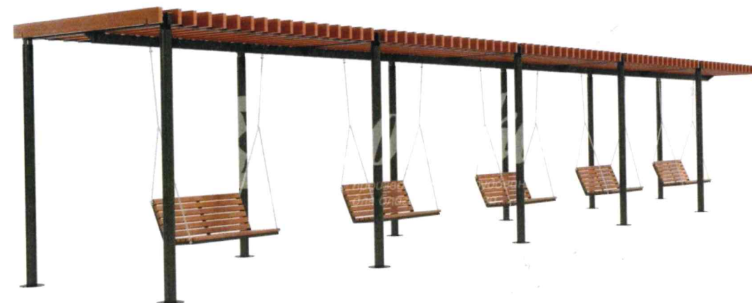
18741 Пергола-качели «Радуга» (2 секции)