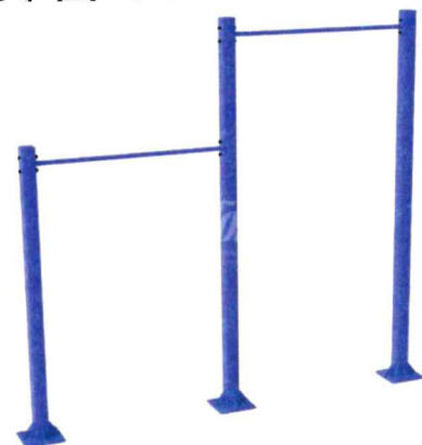
10583 Комплекс турникс для подтягивания