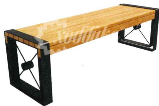
13184 Банкетка стальная «София»