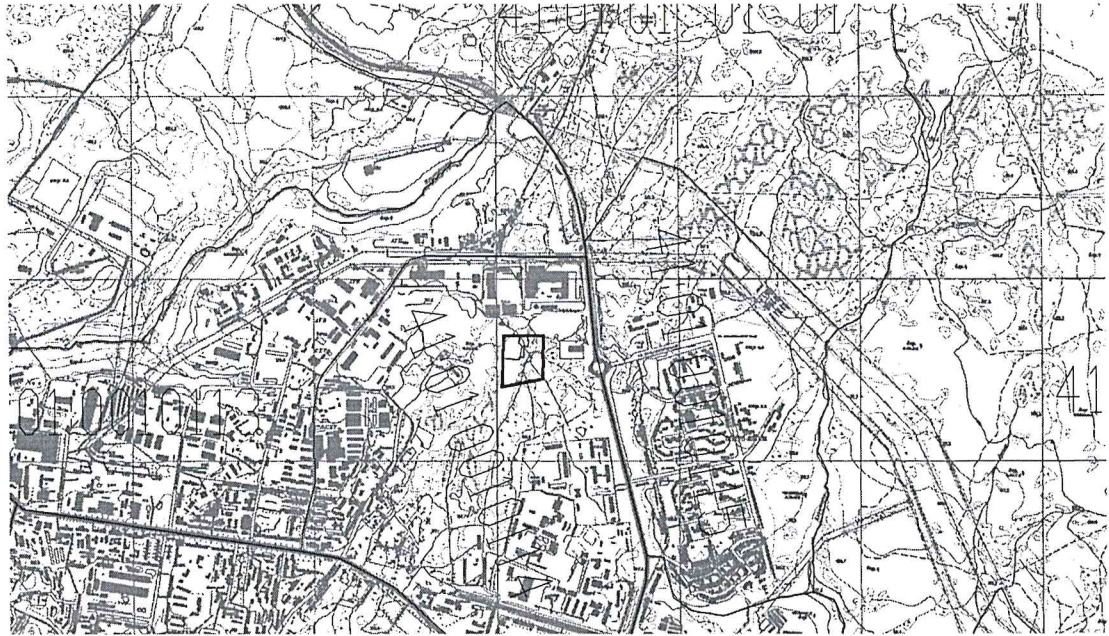
Рис. 1. Размещение проектируемой территории в границах города

Территория, в отношении которой подготовлен Проект межевания расположена в северной части г. Петропавловска-Камчатского, в районе ул. Производственная, проспект Содружества. Площадь территории в границах проекта межевания – 5,65 га.